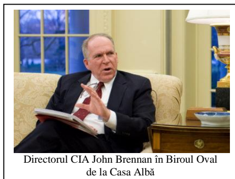
Directorul CIA John Brennan în Biroul Oval de la Casa Albă