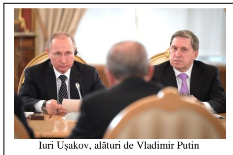
Iuri Uşakov, alături de Vladimir Putin