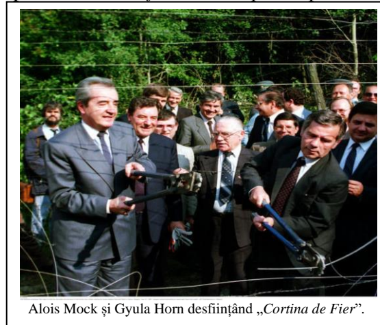
Alois Mock și Gyula Horn desființând „Cortina de Fier”.

• La 27 iunie 1989, miniștrii de externe ungar și austriac, Gyula Horn și, respectiv, Alois Mock „au efectuat o breșă în Cortina de Fier”, prin tăierea gardului de sârmă ghimpată la punctul de frontieră Sopron. Fotografia evenimentului a făcut înconjurul lumii, fiind percepută ca o mărturie a „desființării oficiale a Cortinei de Fier” și ca o expresie a contribuției Ungariei la reușita procesului pașnic de trecere de la dictatura comunistă la democrație. Referitor la semnificația evenimentului, cancelarul federal al RFG avea să spună că aici „a fost smulsă prima piatră din zidul Berlinului”.