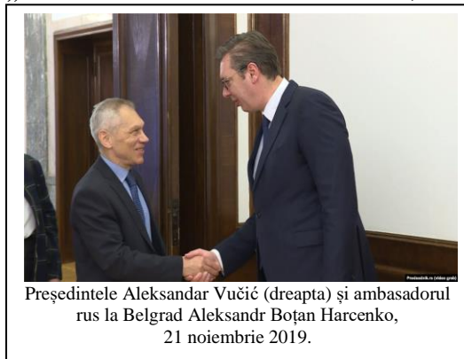
Președintele Aleksandar Vučić (dreapta) și ambasadorul rus la Belgrad Aleksandr Boțan Harcenko, 21 noiembrie 2019.

perspectiva de a se menține astfel, în ciuda poveștilor scandaloase privind presupuse recrutări efectuate de militari ruși, care nu pot afecta în niciun fel alianța noastră.” Referitor la dezvăluirile făcute de Aleksandar Vučić, într-un interviu acordat cotidianului Blic, prim-ministrul Ana Brnabic a declarat: „Dacă toate acestea sunt adevărate, atunci avem o problemă serioasă.”