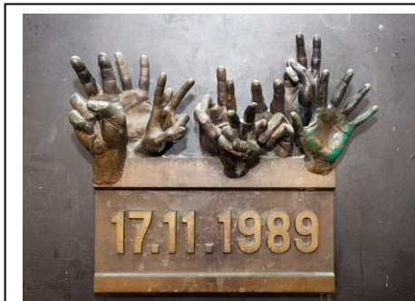
Placa memorială aflată în apropierea locului unde s-a desfășurat confruntarea studenților praghezi cu diversioniștii STB.

În după amiaza zilei de 17 noiembrie 1989, câteva sute de studenți s-au reunit în zona căminelor din campusul universitar din Praga pentru a participa la o demonstrație cu ocazia Zilei Internaționale a Studenților și comemorării a 50 de ani de la reprimarea de către ocupanții germani a unui protest al studenților praghezi, din anul 1939, soldat atunci cu moartea lui Jan Opletal și arestarea a 1.200 dintre participanți.